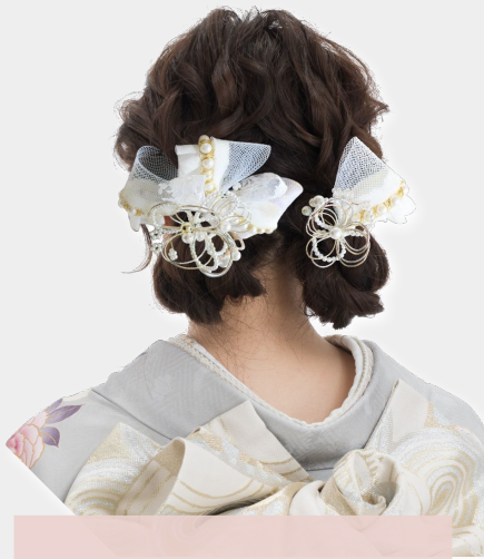
パール&フリルリボン